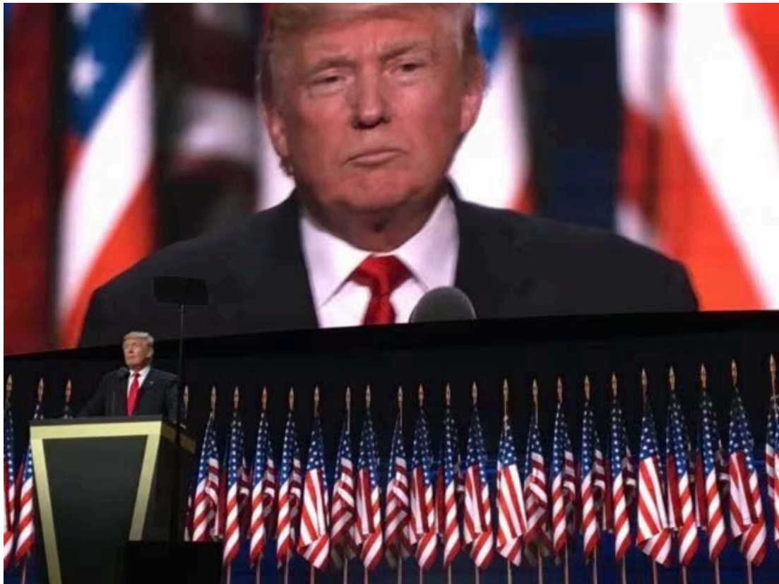
Donald J. Trump, 2016

Andererseits erzeugten die diversen Tabubrüche und Provokationen der öffentlichen Figuren Goldwater und Trump, in Inhalt und Form, nachvollziehbare Befürchtungen, dass im Falle ihres Wahlsieges immense politische und militärische Macht in die Hände von Individuen gelegt werde, die mit dieser Verantwortung nicht konstruktiv umgehen könnten. Was im schlimmsten Falle existentielle Auswirkungen auf die amerikanische Demokratie und sogar den globalen Frieden haben könnte – sowie implizit die psychische Gesundheit der US-Gesellschaft massiv in Mitleidenschaft ziehen würde, deren Schutz im Zentrum des Handelns der „mental health professionals“ steht. Essenziell für solche Szenarien von durch Individuen aus einem Impuls heraus auslösbare (Welt-)Krisen war und ist nicht zuletzt die exzeptionell ausgeprägte Machtposition des Präsidenten oder der Präsidentin. Der US-Historiker Arthur M. Schlesinger Jr. hatte bereits 1973 vor der daraus erwachsenden Gefahr einer „imperialen Präsidentschaft“ gewarnt und damit die im schlimmsten Falle willkürliche und kaum anfechtbare Entscheidungsmacht über Krieg und Frieden sowie den Missbrauch dieser Macht gemeint. 5