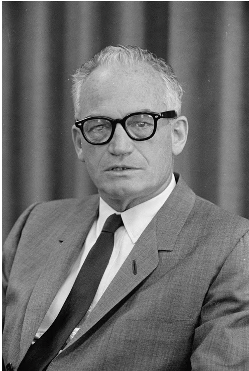
Barry M. Goldwater, 1962