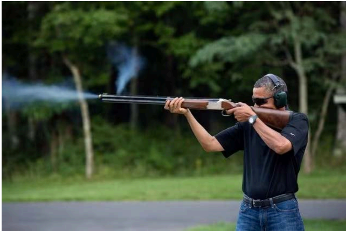
Allmacht des US-Präsidentschaftsamtes als immenses Gewaltpotenzial eines Individuums. (Das Foto zeigt den damaligen Amtsinhaber Barack H. Obama 2012 als Sportschützen (Wurfscheiben)) Foto: Souza, Pete, 04/08/2012, Quelle: Wikimedia Commons, URL: https://commons.wikimedia.org/wiki/File:United_States_President_Barack_Obama_shoots_clay_targets_on_the_range_at_Camp_David,_Maryland.jpg