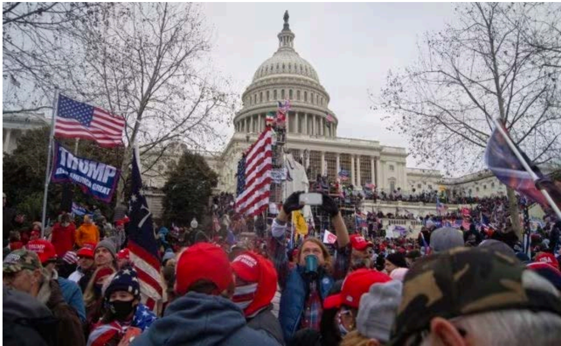
Anhänger:innen des Wahlverlierers beim Kapitol-Sturm am 06/01/2021: Neue Realitäten durch die Ära Trump?