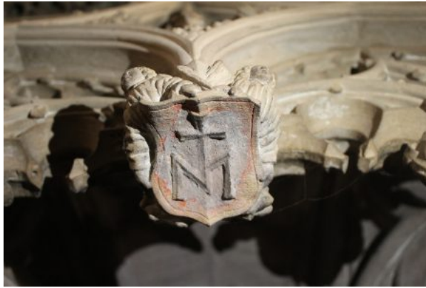
Abb. 2: Etwas versteckt, aber doch selbstbewusst platzierte Hans Hammer sein Meisterzeichen an der Kanzel des Straßburger Münsters: Engel präsentieren es genauso wie die Leidenswerkzeuge Christi an den benachbarten Konsolen. Es sind noch Reste der ehemals buntfarbigen Fassung zu erkennen