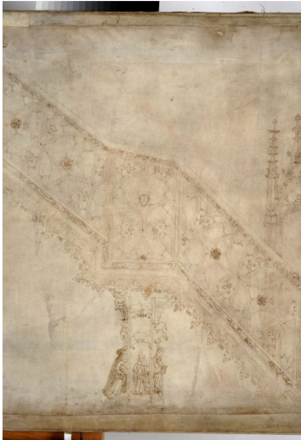
Abb. 3a u. 3b: Das Meisterzeichen von Hans Hammer findet sich ein zweites Mal an der Kanzel, nämlich am Treppenpodest (links). An dieser Position taucht es auch schon in der Entwurfszeichnung auf (rechts, Detail von Straßburg, FOND, Collection graphique, Nr. 18) © 3a: Gödl, 3b: Musées de la ville de Strasbourg (Foto: Mathieu Bertola)

Kurz darauf wurde er mit dem prestigeträchtigen Posten des Werkmeisters des Straßburger Frauenwerks (Fondation de l'Œuvre Notre Dame), 3 also der Leitung des auf der Münsterbaustelle tätigen Steinmetzhandwerks, betraut. In Ermangelung einer institutionalisierten Ausbildung war das Einnehmen einer Führungsrolle im Steinmetzhandwerk daran gebunden, ob man glaubwürdig vertreten konnte, die notwendigen Qualifikationen mitzubringen. Hans Hammer war das mit der Kanzel ganz offensichtlich gelungen. Ergaben sich doch einmal Zweifel, zum Beispiel bezüglich der Statik, zählten die Bauherren auf ein Gutachten anderer Werkmeister. 4 Wurde dann das handwerkliche Können und die Qualität der Arbeit eines Meisters in Frage gestellt, konnte das weitreichende Auswirkungen haben. Um das zu verhindern, war es wichtig, über einen guten Leumund zu verfügen.