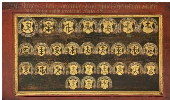
Abb. 5: Die noch wenig erforschte Bruderschaftstafel aus dem 17. Jahrhundert gibt noch Rätsel auf. Dokumentiert und – in begrenztem Maße – veröffentlicht wurde damit der Teilnehmerkreis verschiedener Handwerksversammlungen, vermutlich im Zusammenhang mit der Straßburger Steinmetzbruderschaft