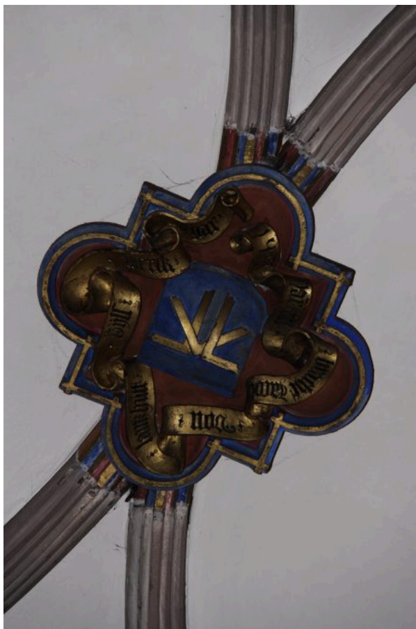
Abb. 1a u. 1b: Steinmetzzeichen können relativ schlicht ausgeführt sein, wie auf der Treppe im Straßburger Frauenwerk (links). Sie können als Signatur des Entwerfers aber auch sehr aufwendig gestaltet sein, wie das von Jacob von Landshut auf dem Gewölbeschlussstein der sog. Laurentiuskapelle des Straßburger Münsters (rechts) © 1a: Göldl, 1b: Fondation de l'Œuvre Notre-Dame, Straßburg