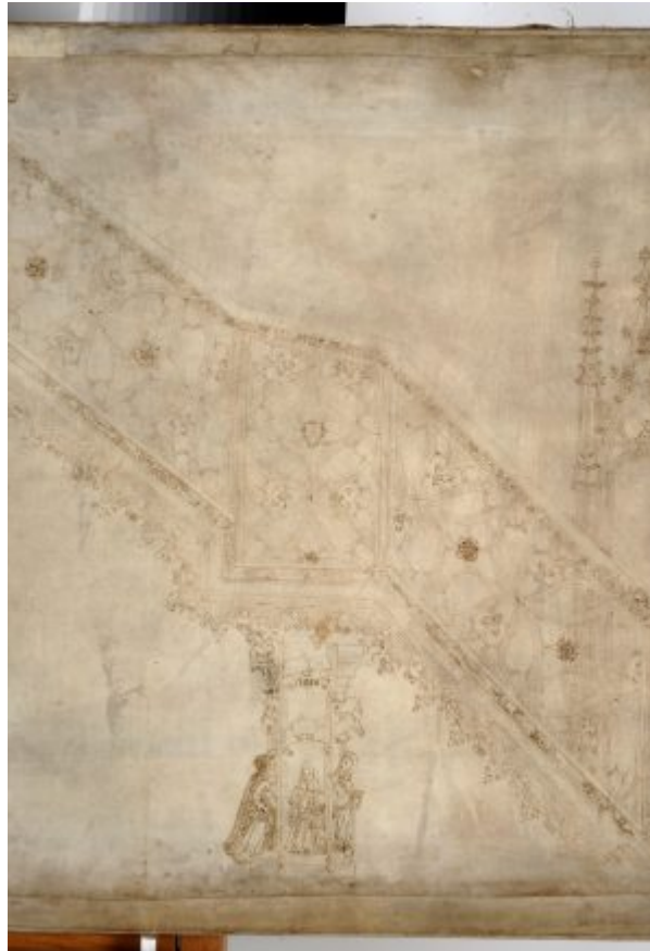
Abb. 3a u. 3b: Das Meisterzeichen von Hans Hammer findet sich ein zweites Mal an der Kanzel, nämlich am Treppenpodest (links). An dieser Position taucht es auch schon in der Entwurfszeichnung auf (rechts, Detail von Straßburg, FOND, Collection graphique, Nr. 18)

Kurz darauf wurde er mit dem prestigeträchtigen Posten des Werkmeisters des Straßburger Frauenwerks (Fondation de l'Œuvre Notre Dame), also der Leitung des auf der Münsterbaustelle tätigen Steinmetzhandwerks, betraut. In Ermangelung einer institutionalisierten Ausbildung war das Einnehmen einer Führungsrolle im Steinmetzhandwerk daran gebunden, ob man glaubwürdig vertreten konnte, die notwendigen Qualifikationen mitzubringen. Hans Hammer war das mit der Kanzel ganz offensichtlich gelungen. Ergaben sich doch einmal Zweifel, zum Beispiel bezüglich der Statik, zählten die Bauherren auf ein Gutachten anderer Werkmeister. Wurde dann das handwerkliche Können und die Qualität der Arbeit eines Meisters in Frage gestellt, konnte das weitreichende Auswirkungen haben. Um das zu verhindern, war es wichtig, über einen guten Leumund zu verfügen.