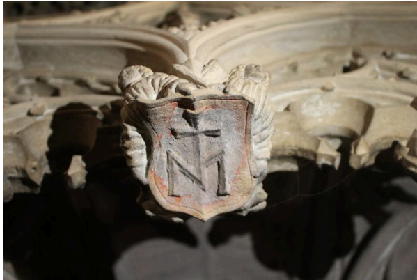
Abb. 2: Etwas versteckt, aber doch selbstbewusst platzierte Hans Hammer sein Meisterzeichen an der Kanzel des Straßburger Münsters: Engel präsentieren es genauso wie die Leidenswerkzeuge Christi an den benachbarten Konsolen. Es sind noch Reste der ehemals buntfarbigen Fassung zu erkennen