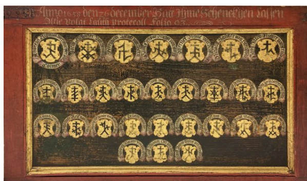
Abb. 5: Die noch wenig erforschte Bruderschaftstafel aus dem 17. Jahrhundert gibt noch Rätsel auf. Dokumentiert und – in begrenztem Maße – veröffentlicht wurde damit der Teilnehmerkreis verschiedener Handwerksversammlungen, vermutlich im Zusammenhang mit der Straßburger Steinmetzbruderschaft

Straßburg in Julio An[n]o 1657 gewesen vnd dieselbe gehalten haben“. Namen und Zeichen beglaubigen in diesem Fall den Teilnehmerkreis der Handwerksversammlung und somit vermutlich, wer sich fortgesetzt der Bruderschaftsordnung unterwarf. Auch wer keinen Zugang zu diesen Schriftquellen hatte oder nicht lesen konnte, konnte anhand der dokumentarisch-beglaubigenden Eigenschaft der Tafel erkennen, welche Meister Teil des Bruderschaftsnetzwerkes waren. Es handelt sich mithin um eine Art Gegenentwurf zu den Schelmentafeln. Auf den späteren Flügeln wird zudem sehr genau auf einzelne Seiten von Protokollen dieser Sitzungen verwiesen, bei denen leider unklar ist, welche Dokumente genau gemeint sind. Dieser Verweis unterstreicht die Bekanntmachungsfunktion und mögliche Bindungswirkung der Tafel. Erstere blieb freilich zunächst auf den Betrachterkreis vor Ort begrenzt, dessen Zugänglichkeit durch den variablen Aufstellungsort zusätzlich moderiert werden konnte. Die Tafel dürfte aber dennoch eine größere Teilöffentlichkeit geschaffen haben als die im Archiv verwahrten Protokolle. Durch die Abbildung ihres Meisterzeichens bekräftigten die Beteiligten zum einen ihre Zugehörigkeit zur Ordnung untereinander, zum anderen konnte im Außenverhältnis kommuniziert werden, wer von den Vorteilen der Ordnung und dem Rückhalt der anderen Bruderschaftsmitglieder profitierte.